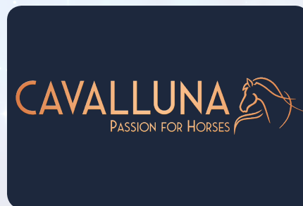
CAVALLUNA-Logo als PNG