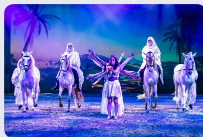
Szenen voller Fantasie